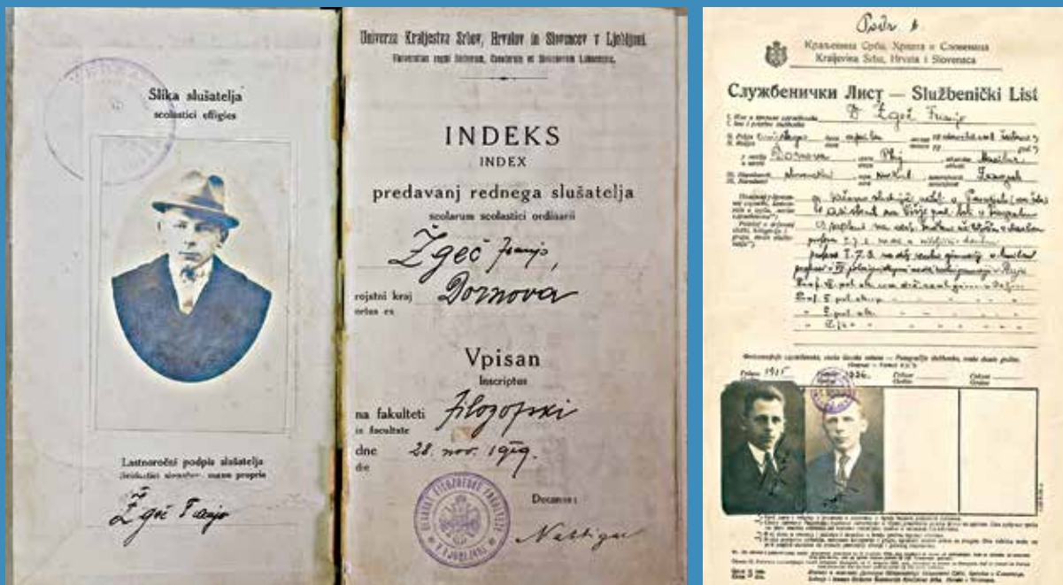
Indeks Franja Žgeča, Filozofska fakulteta Ljubljana